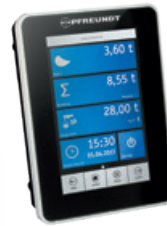
1 Mérleg elektronika (Fejegyység)