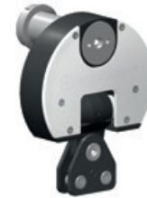
2 Mérőelem ASK-2