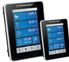
1 Mérleg elektronika (Fejegység)