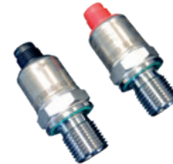
2 Nyomá szenzorok